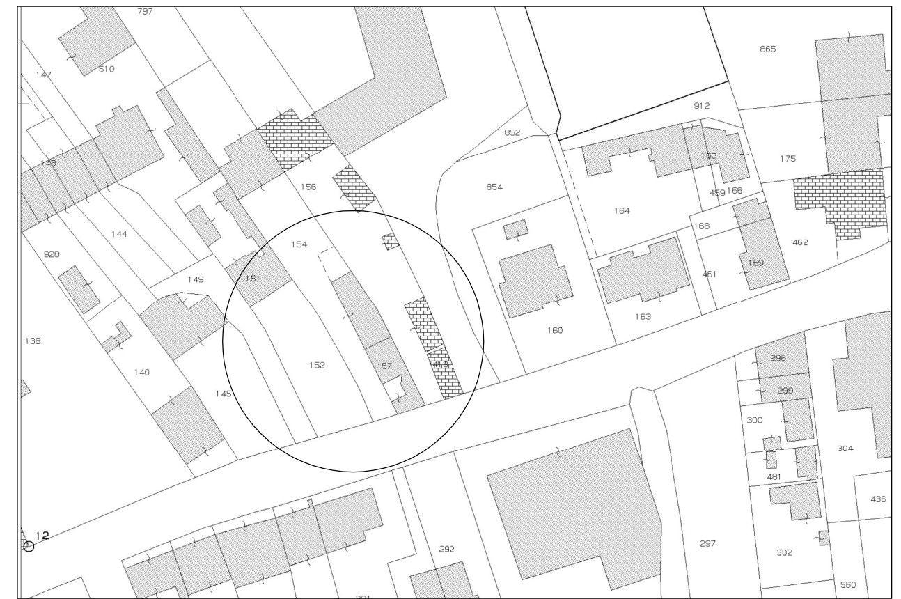
ESTRATTO DELLA MAPPA CATASTALE - scala 1:2.000