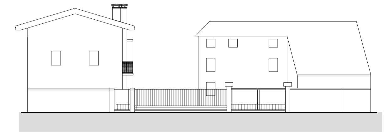
Profilo su Piazza E. Codotto

REGIONE AUTONOMA FRIULI - VENEZIA GIULIA COMUNE DI LATISANA PROVINCIA DI UDINE